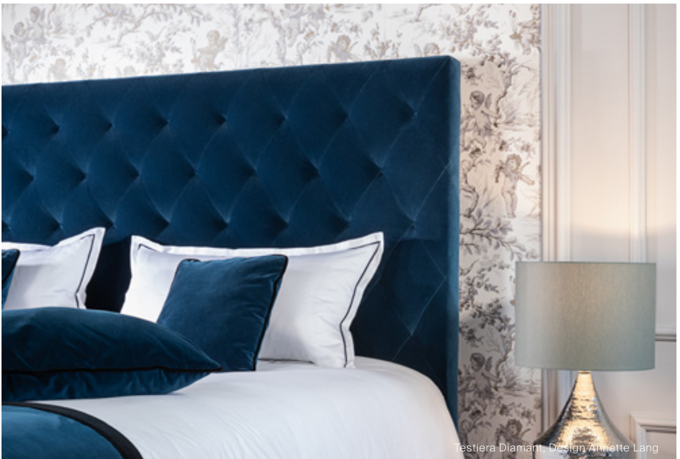
Testiera Diamant, Design Annette Lang