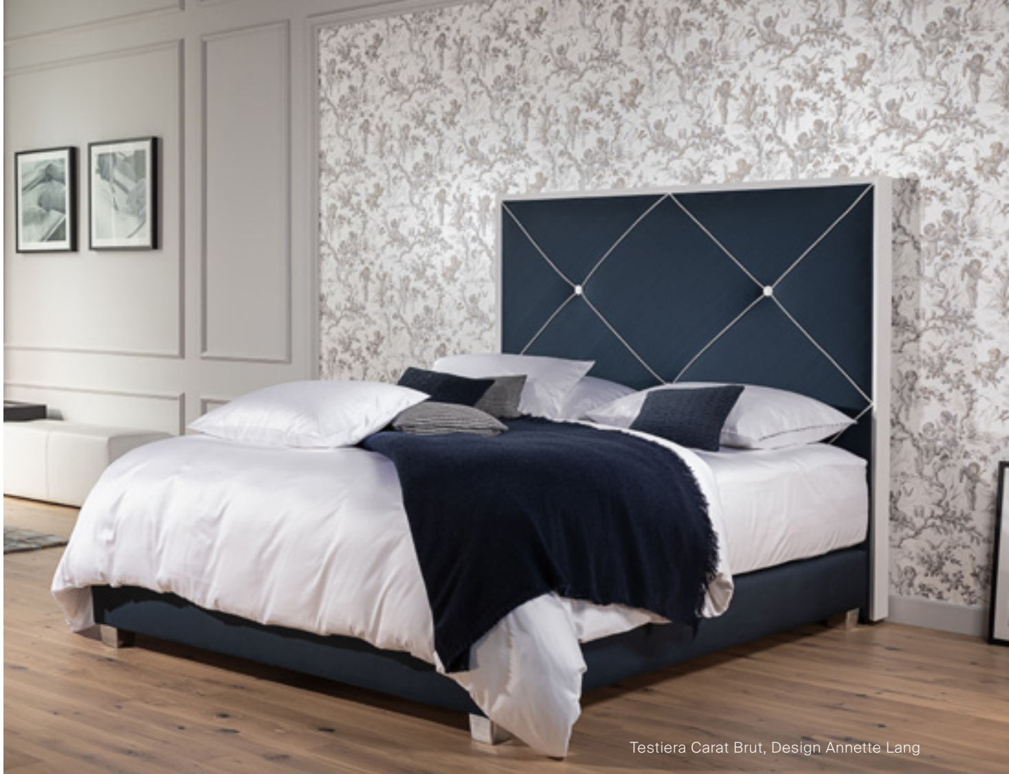
Testiera Carat Brut, Design Annette Lang