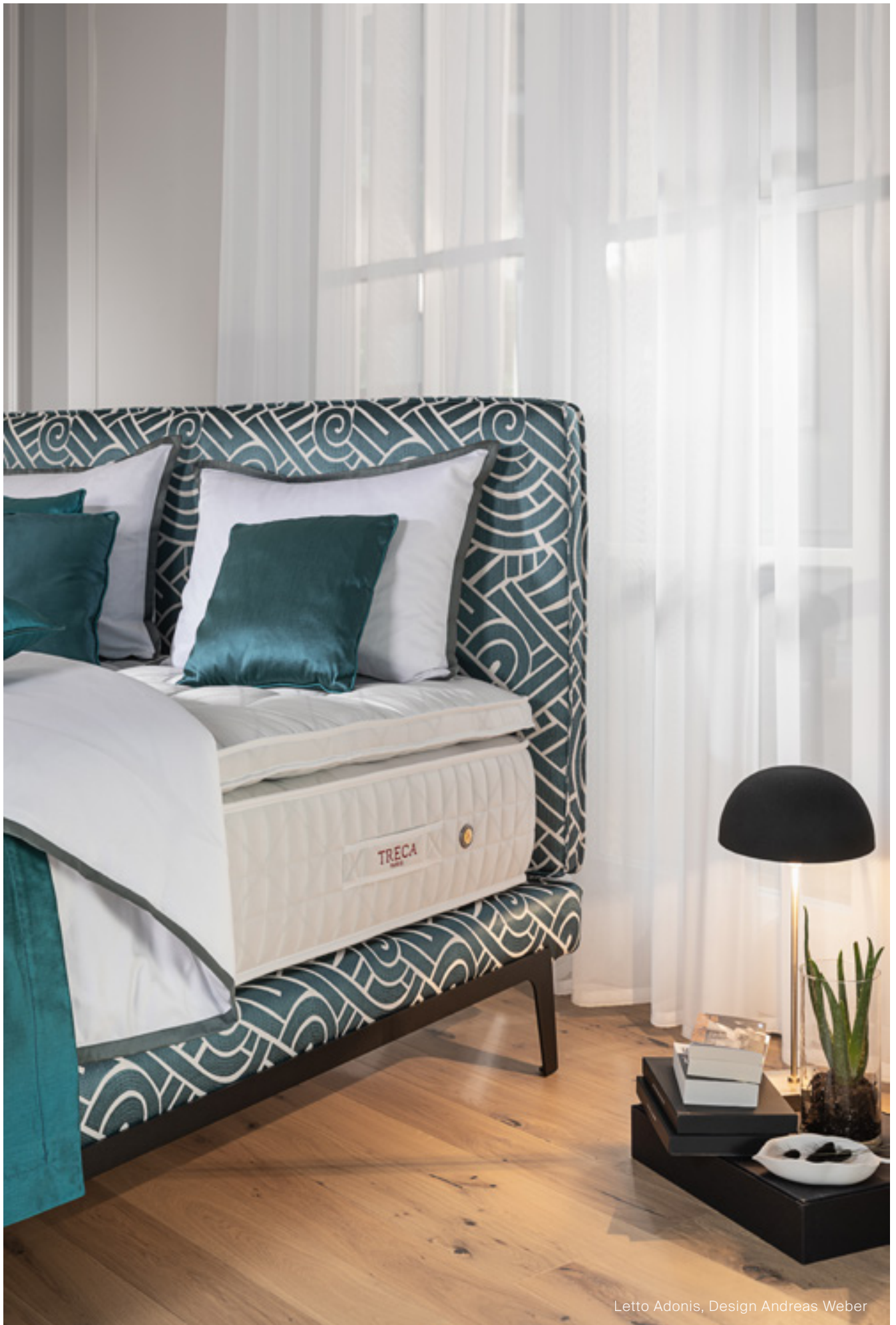
Letto Adonis, Design Andreas Weber