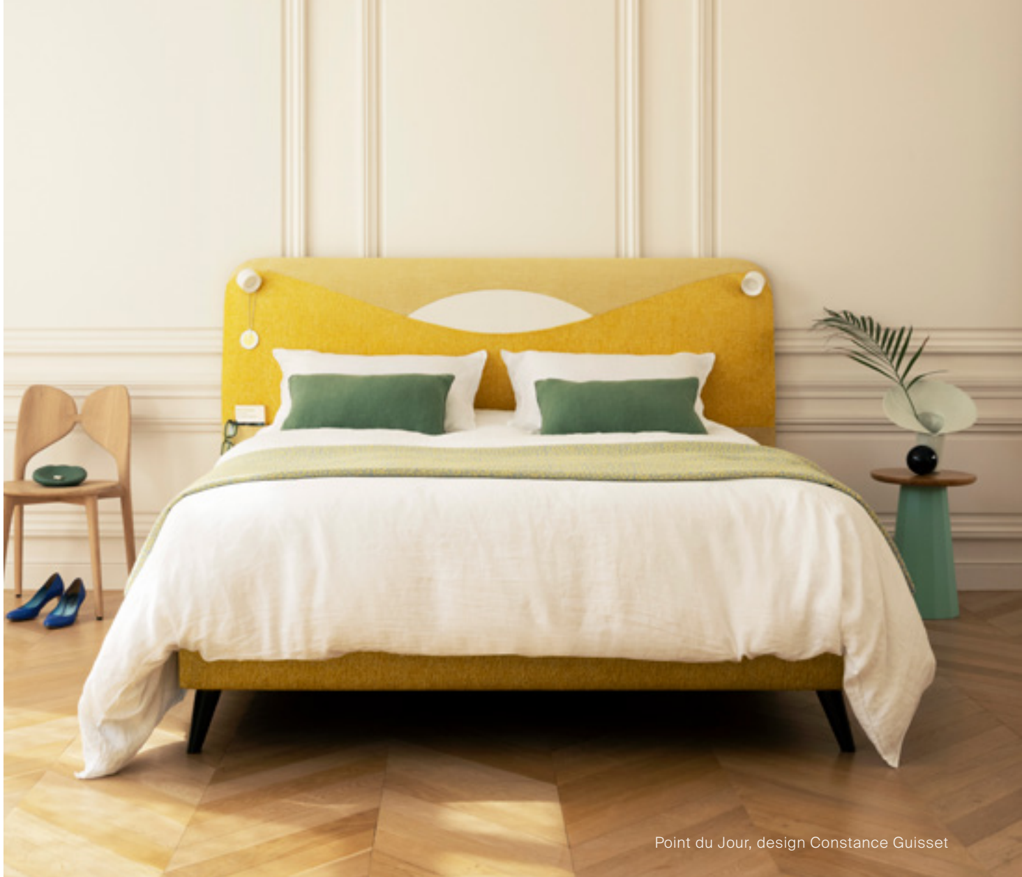
Point du Jour, design Constance Guisset