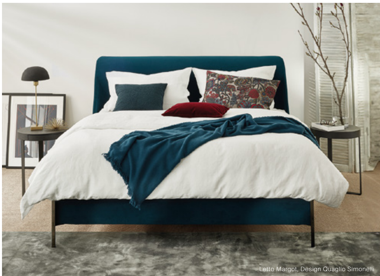
Letto Margot, Design Quaglio Simonelli