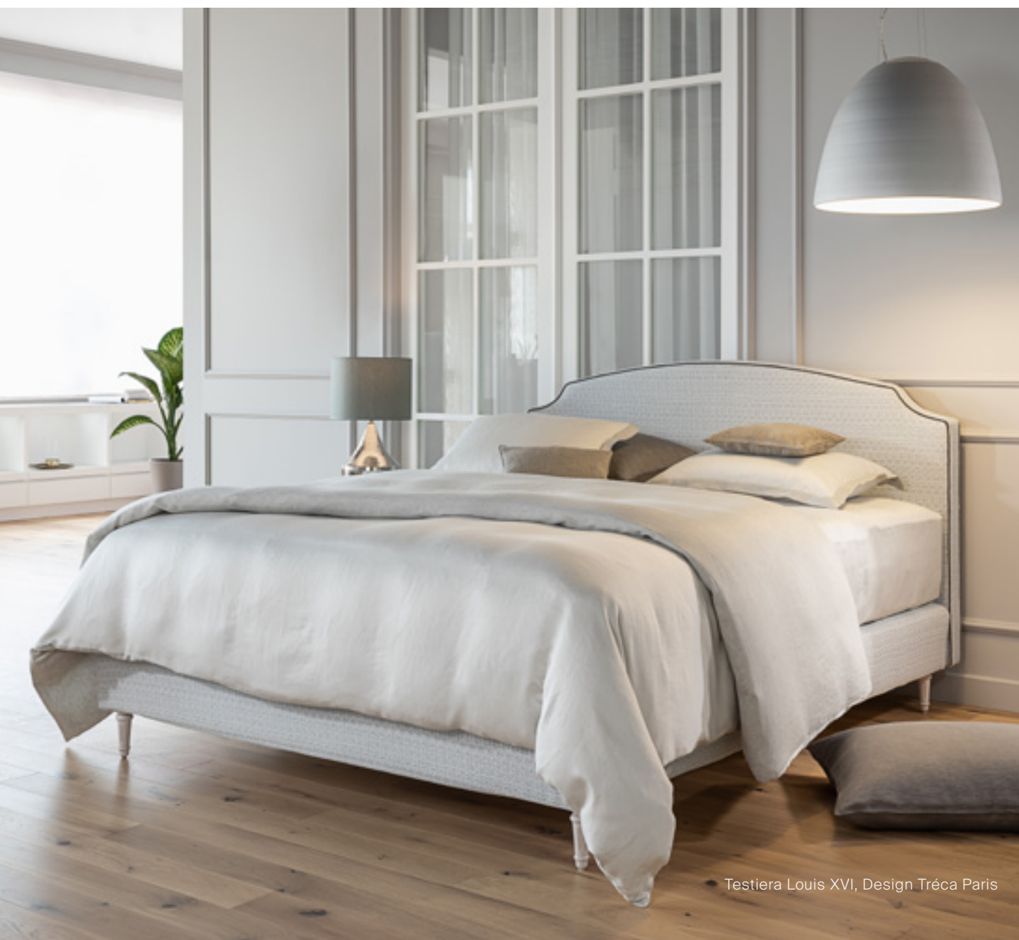
Testiera Louis XVI, Design Tréca Paris

Cio nonostante, la nostra creatività si estende oltre il nostro team interno. Collaboriamo con designer esterni per attingere alle loro prospettive diversificate e alle loro competenze nell'ottica di arricchire la nostra offerta. Questo sforzo collettivo garantisce che ogni creazione, sia essa il frutto del nostro team interno o di collaborazioni, incarni l'essenza del lusso e la raffinatezza nel mondo dei letti.