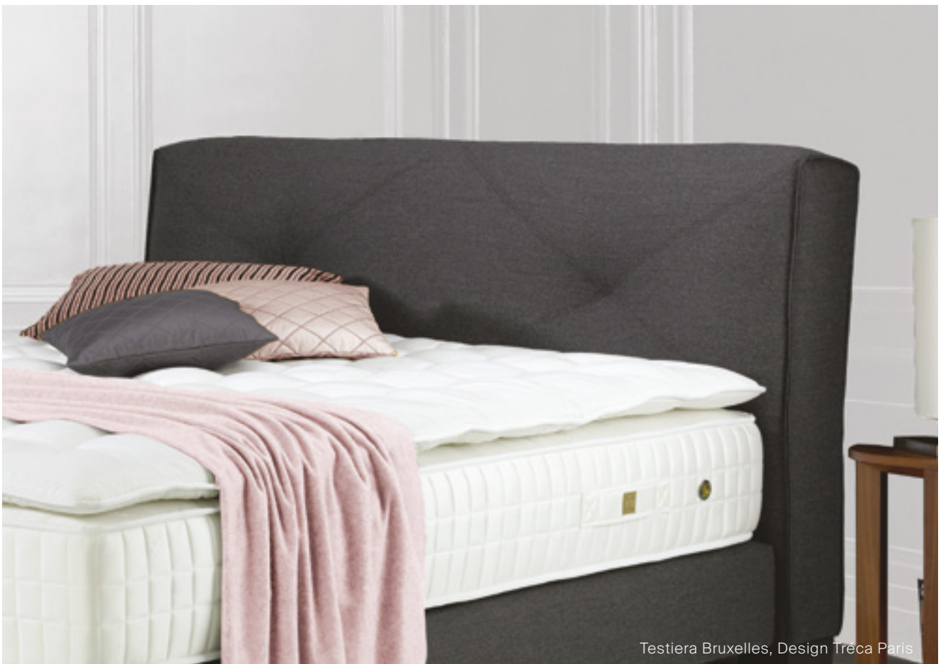
Testiera Bruxelles, Design Treca Paris