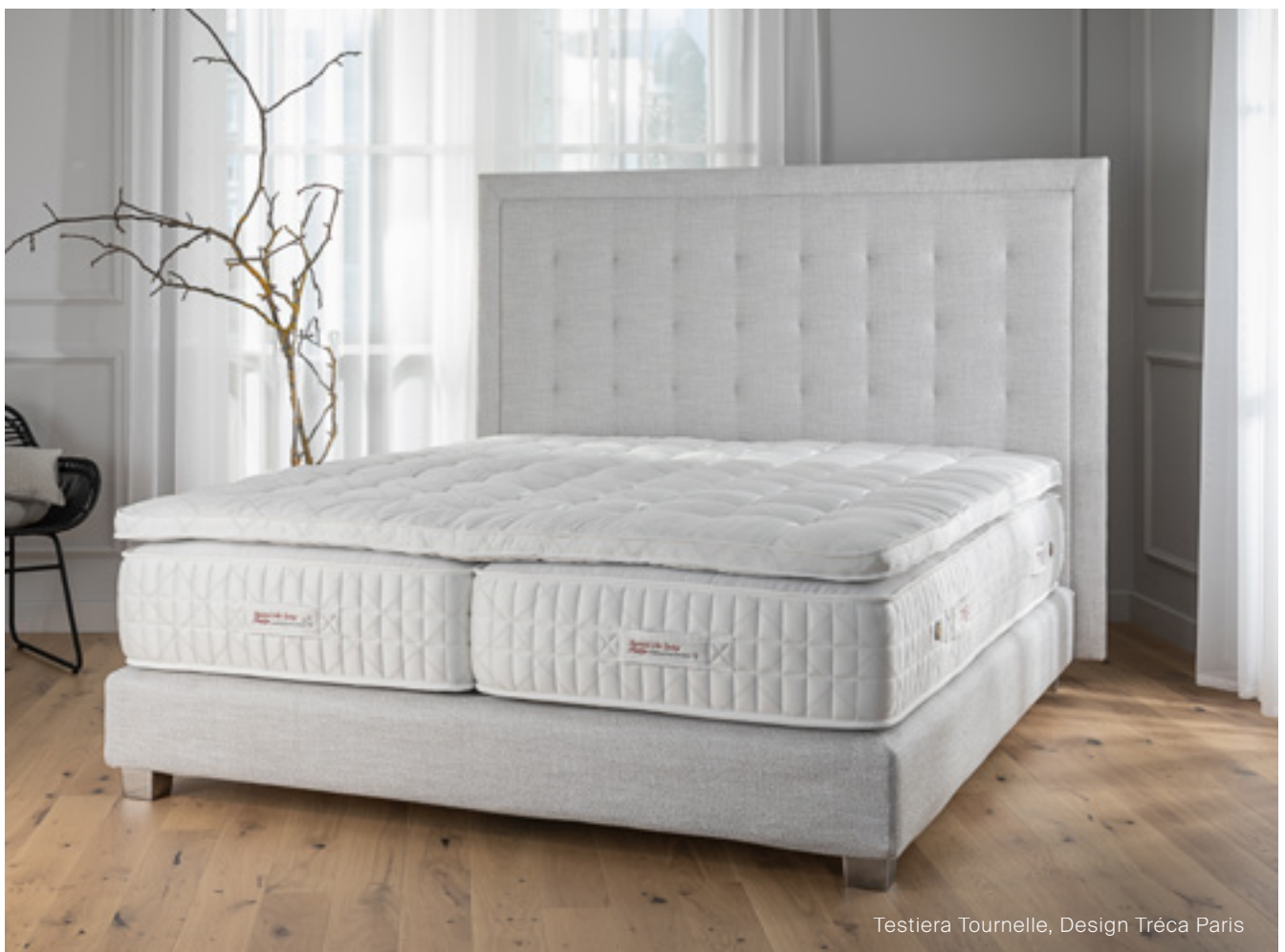
Testiera Tournelle, Design Tréca Paris