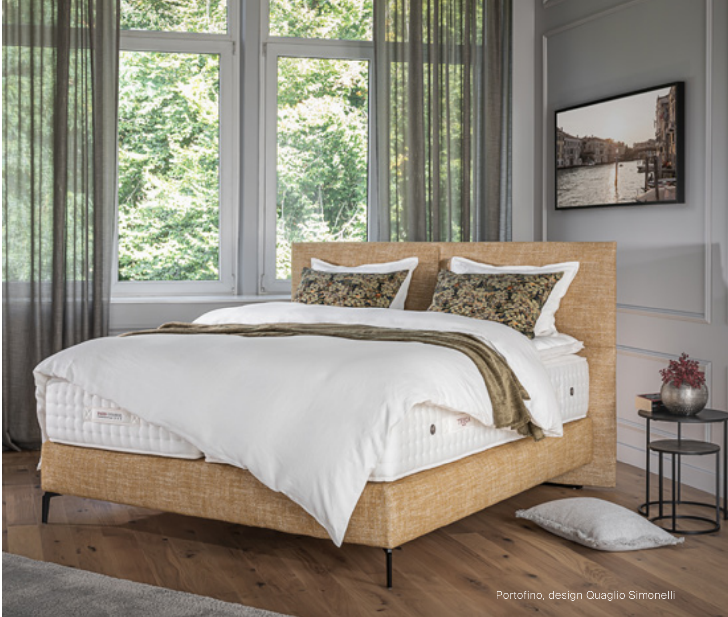
Portofino, design Quaglio Simonelli