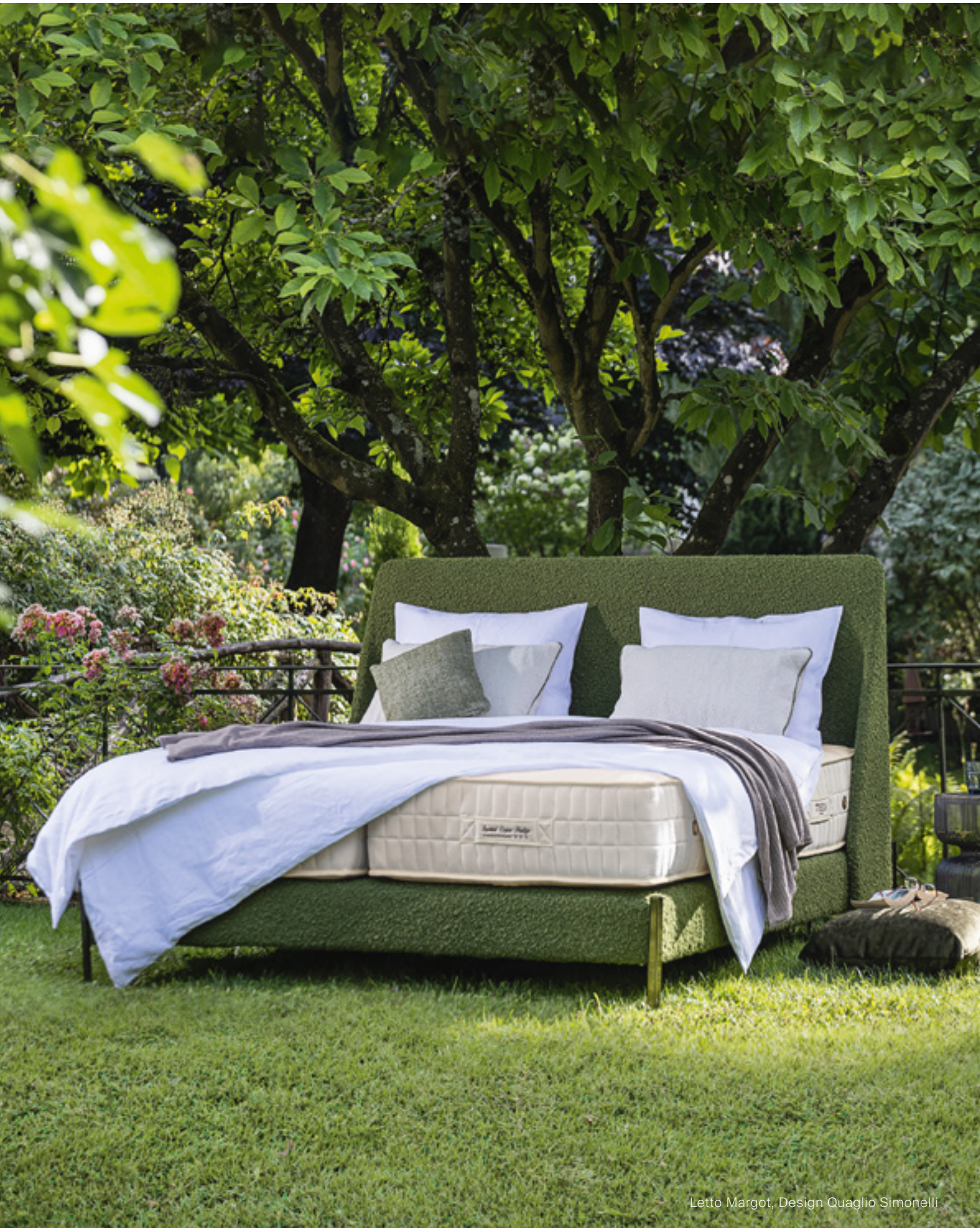
Letto Margot, Design Quaglio Simonelli