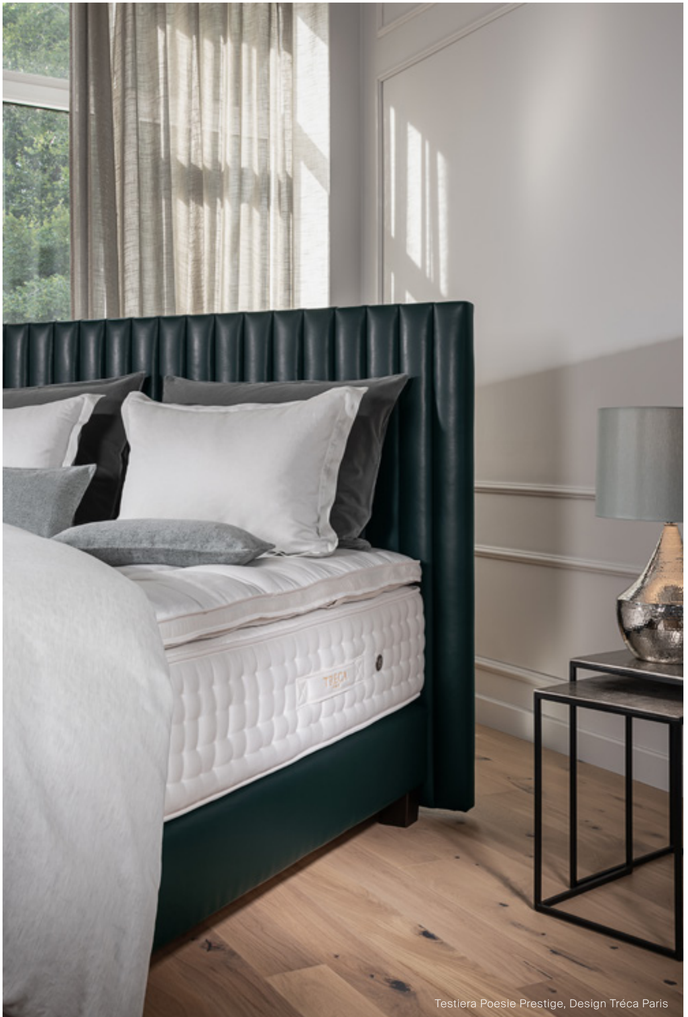
Testiera Poesie Prestige, Design Tréca Paris