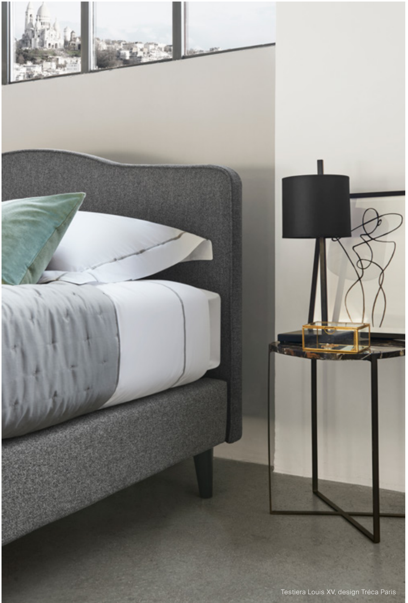
Testiera Louis XV, design Tréca Paris