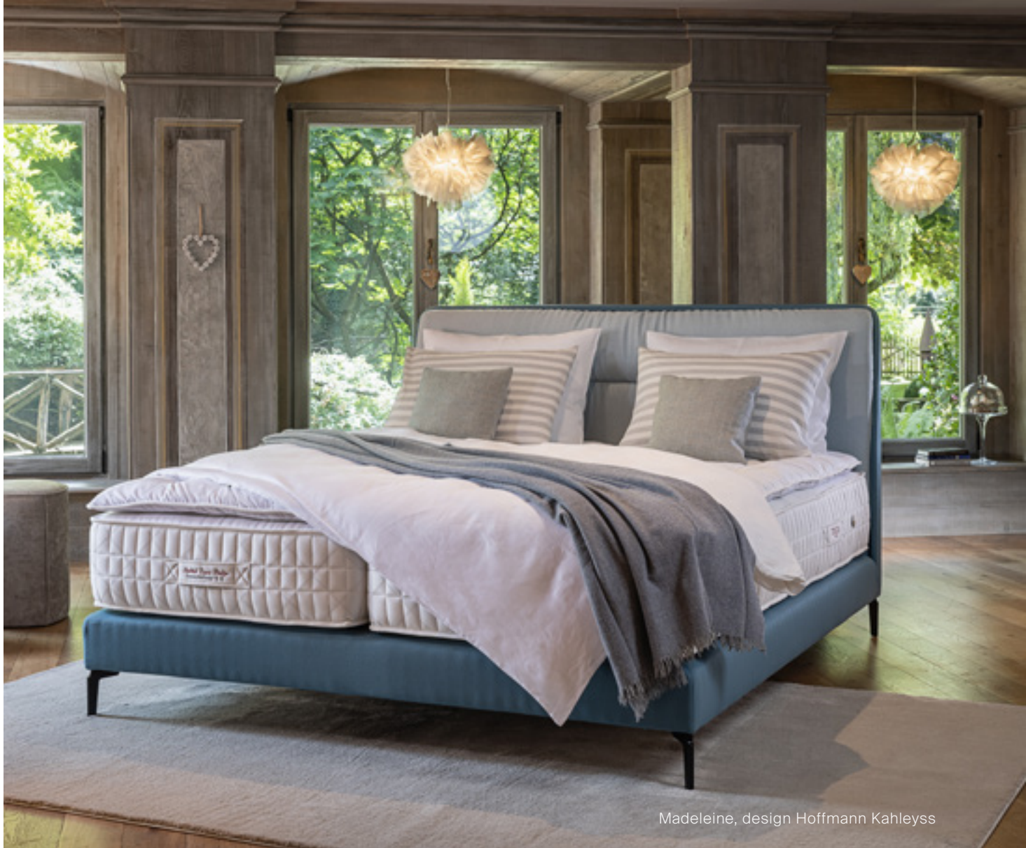
Madeleine, design Hoffmann Kahleiss