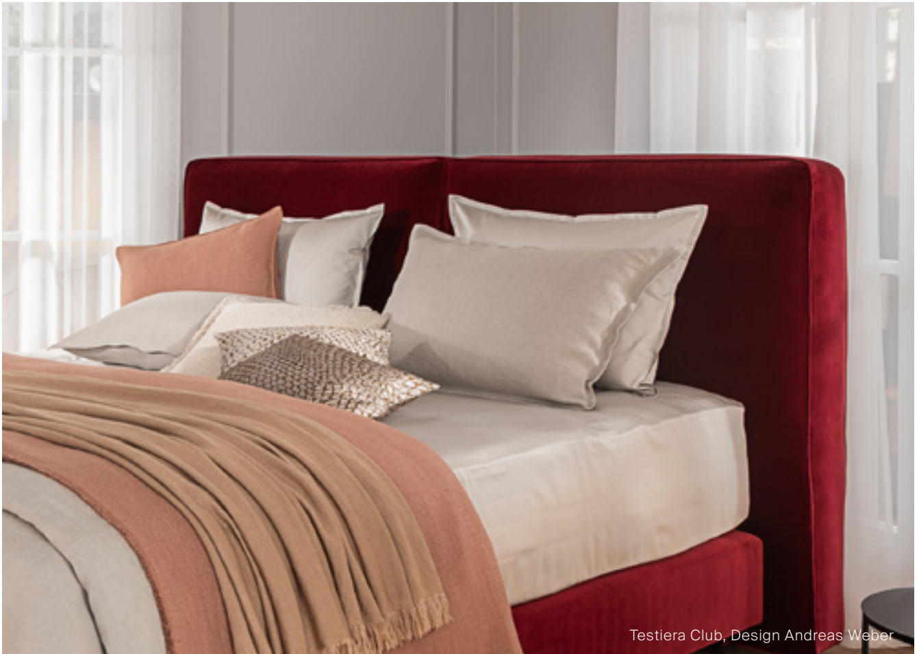
Testiera Club, Design Andreas Weber