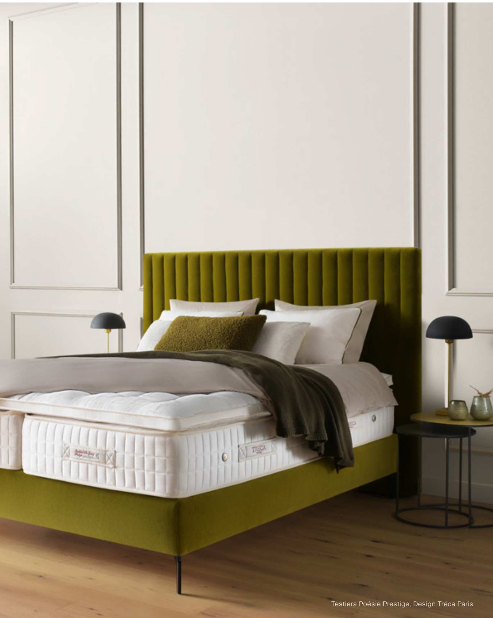
Testiera Poésie Prestige, Design Tréca Paris