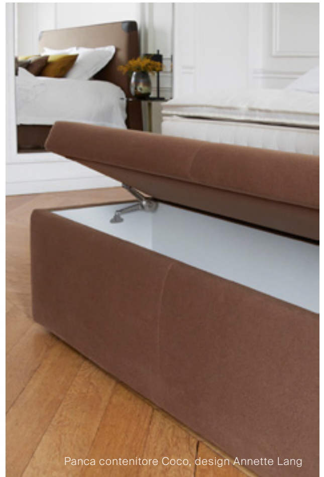
Panca contenitore Coco, design Annette Lang