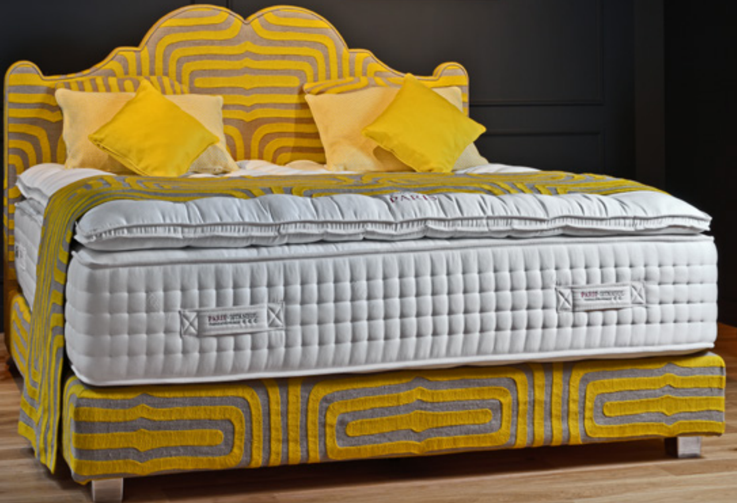
Testiera Versailles Prestige, Design Tréca Paris