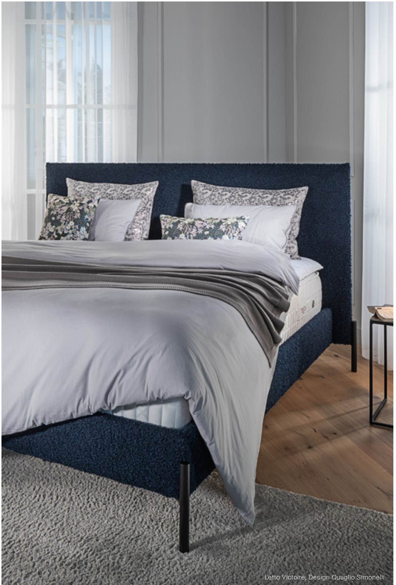
Letto Victoire, Design Quaglio Simonelli