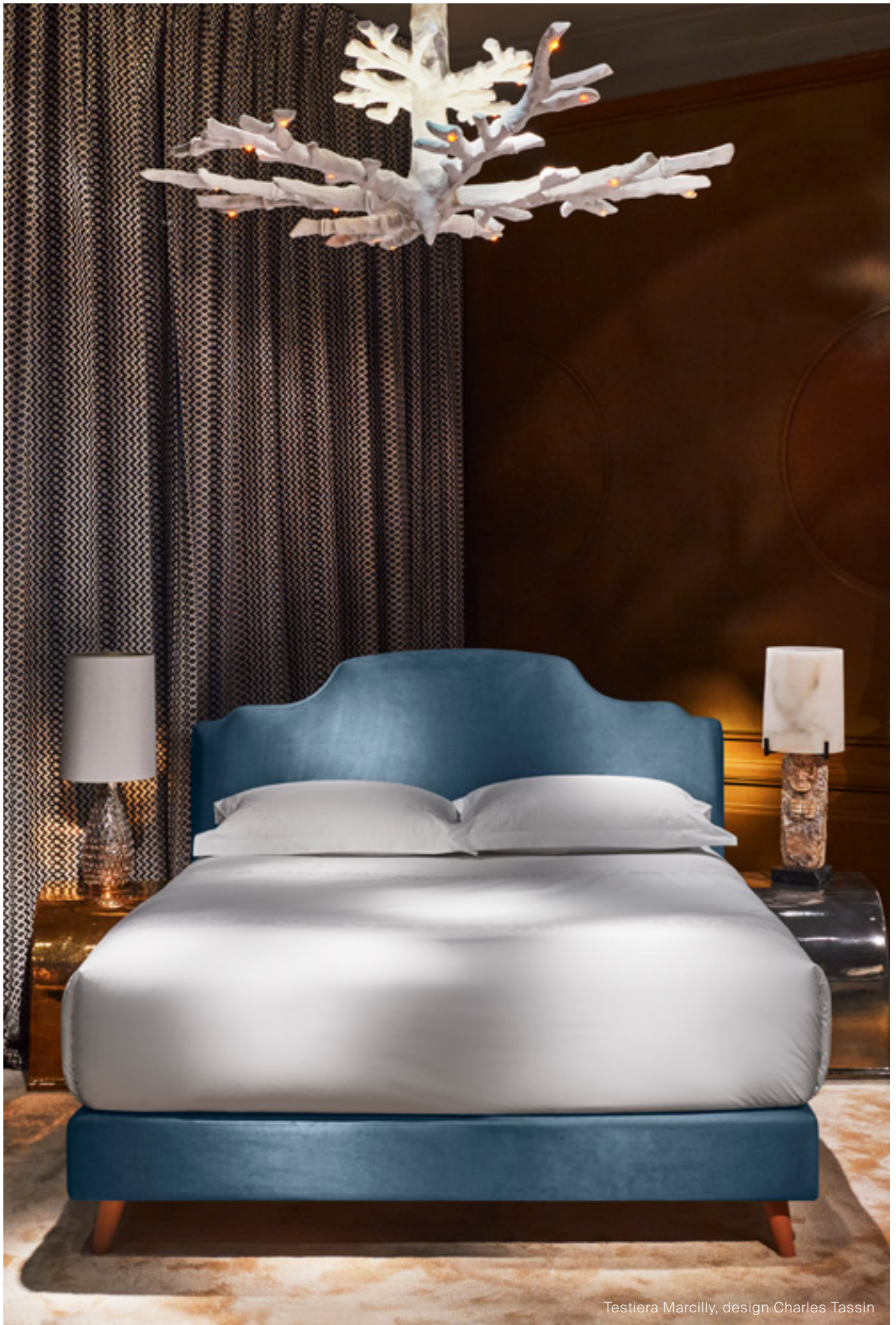
Testiera Marcilly, design Charles Tassin