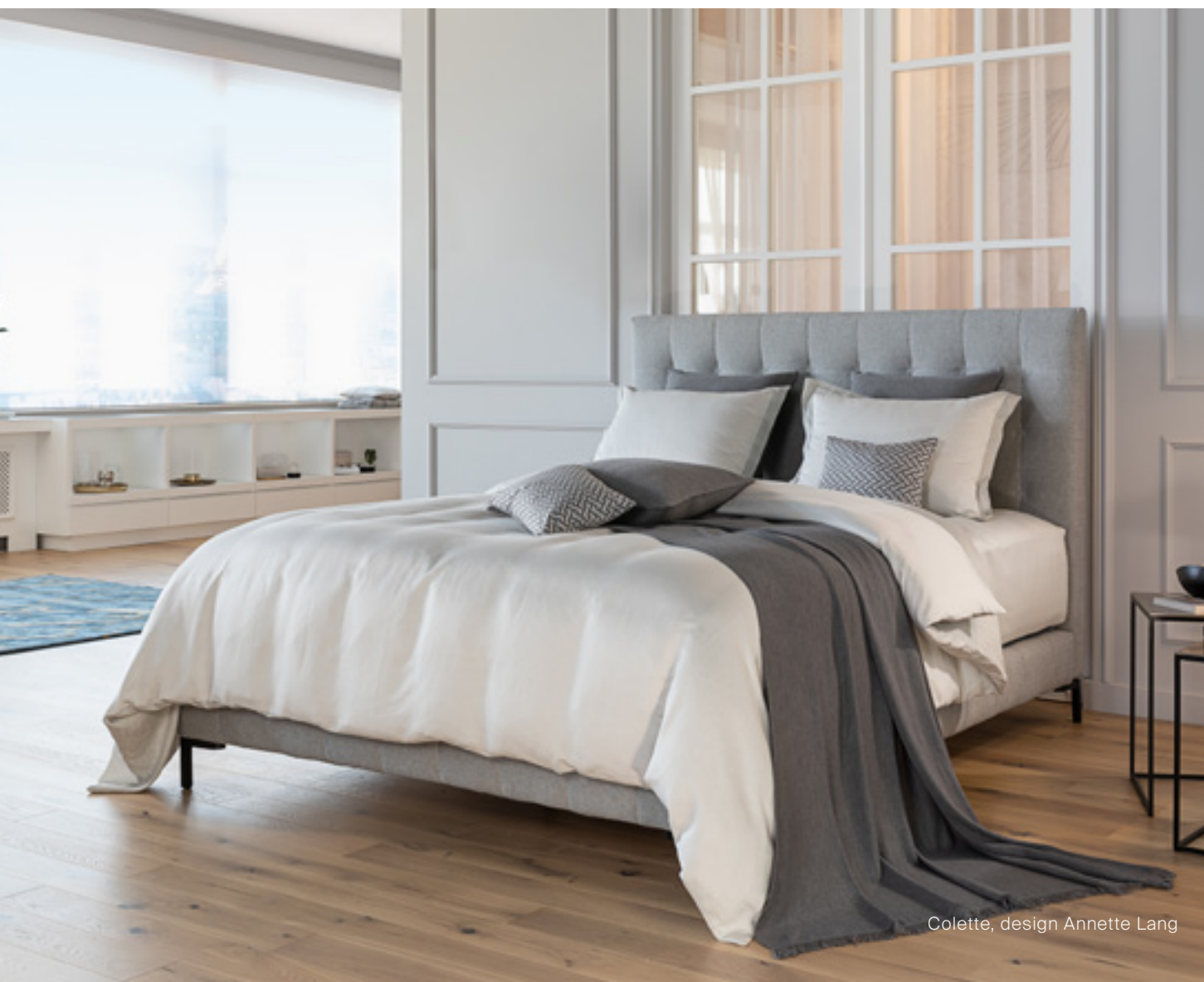
Colette, design Annette Lang