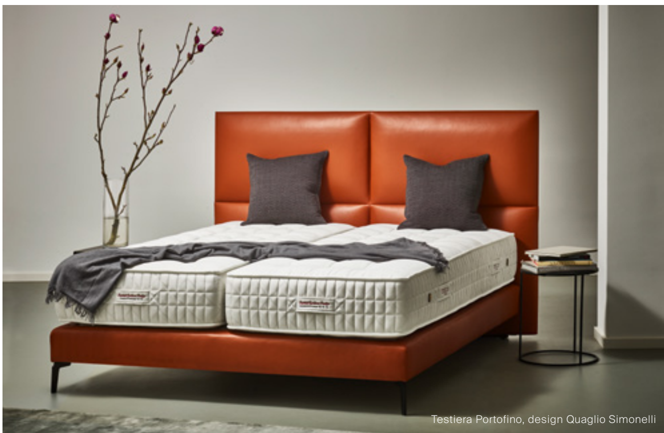
Testiera Portofino, design Quaglio Simonelli

In Tréca, il percorso che conduce a un letto su misura non solo riflette un impegno verso la soddisfazione delle esigenze individuali, ma dimostra anche la nostra abilità nel lavorare con pelli di alta qualità, assicurandoci che ciascun elemento del vostro letto comunichi lusso e raffinatezza.