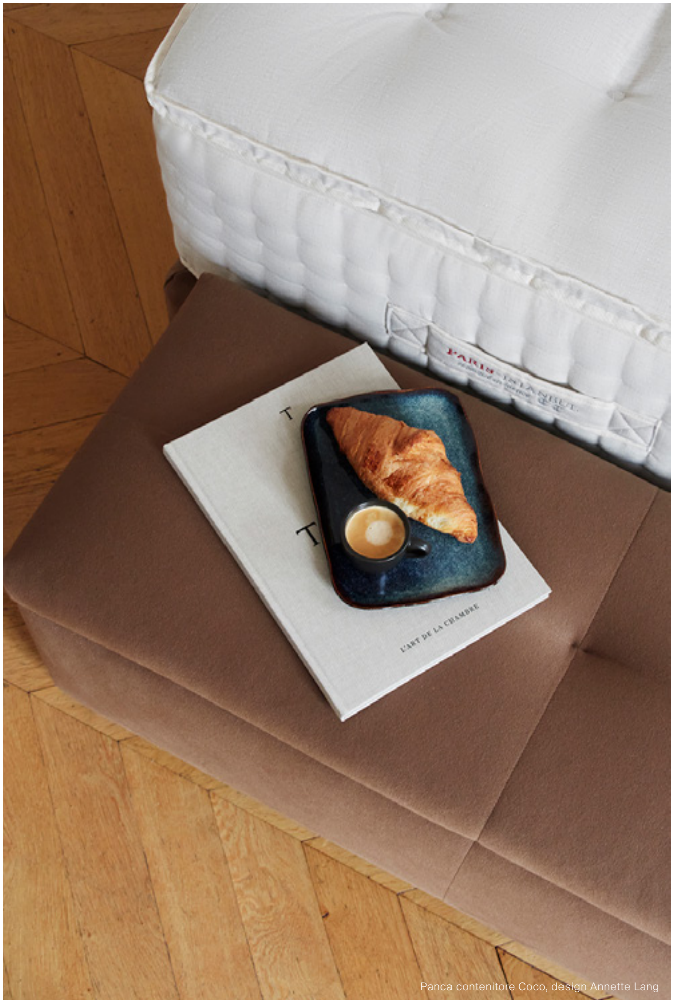
Panca contenitore Coco, design Annette Lang