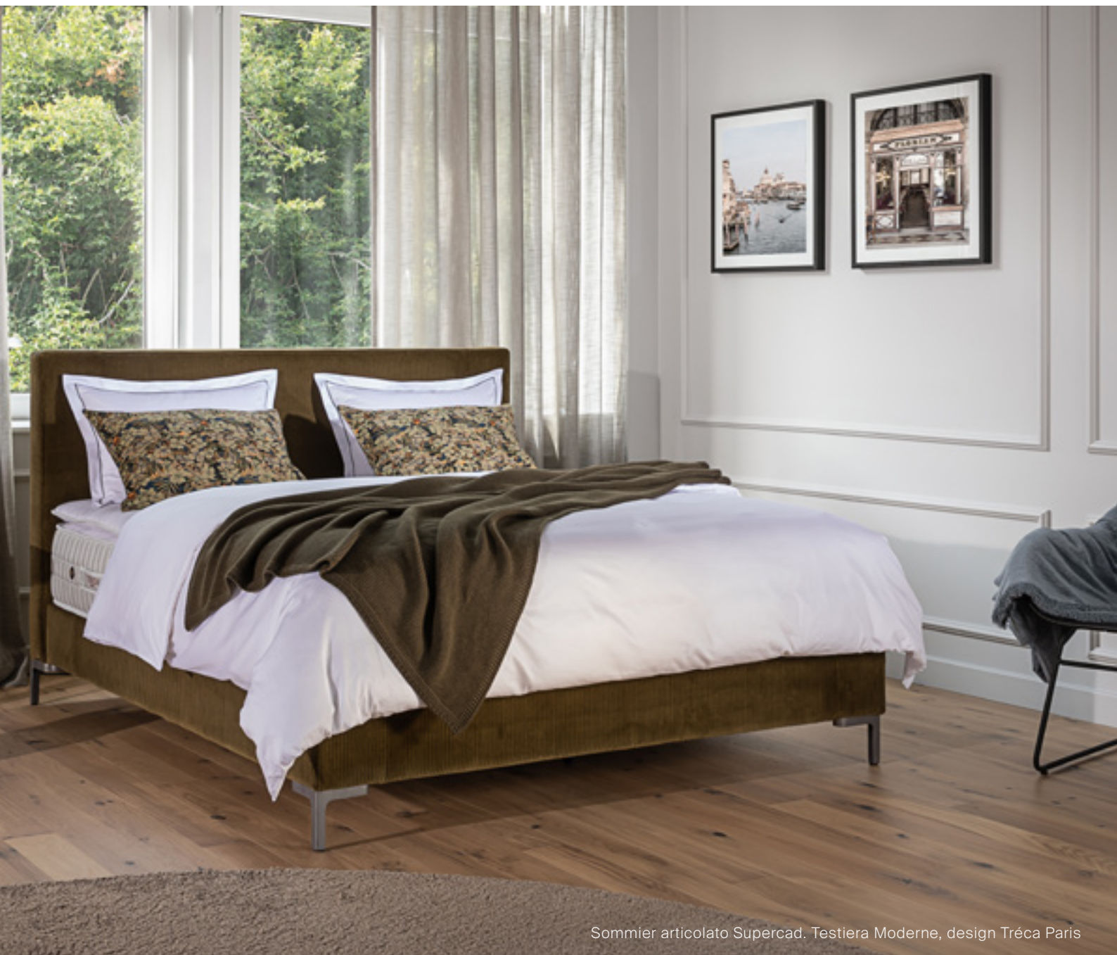
Sommier articolato Supercad. Testiera Moderne, design Tréca Paris