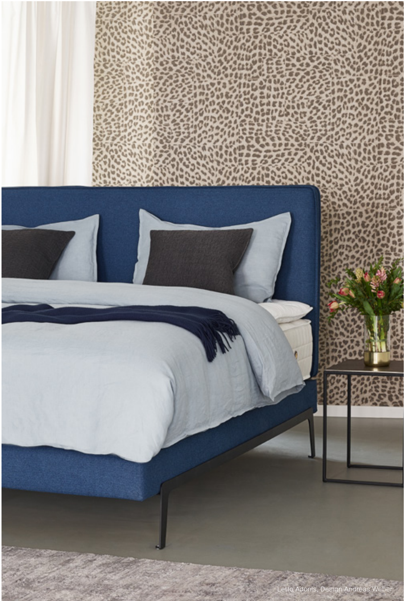
Letto Adonis, Design Andreas Weber