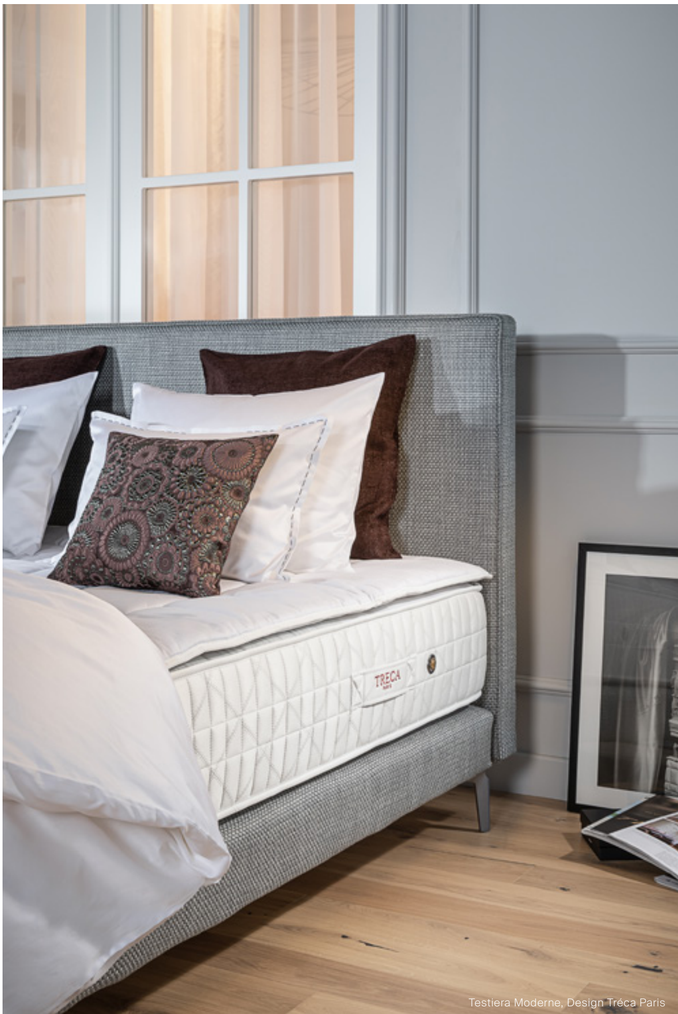
Testiera Moderne, Design Tréca Paris