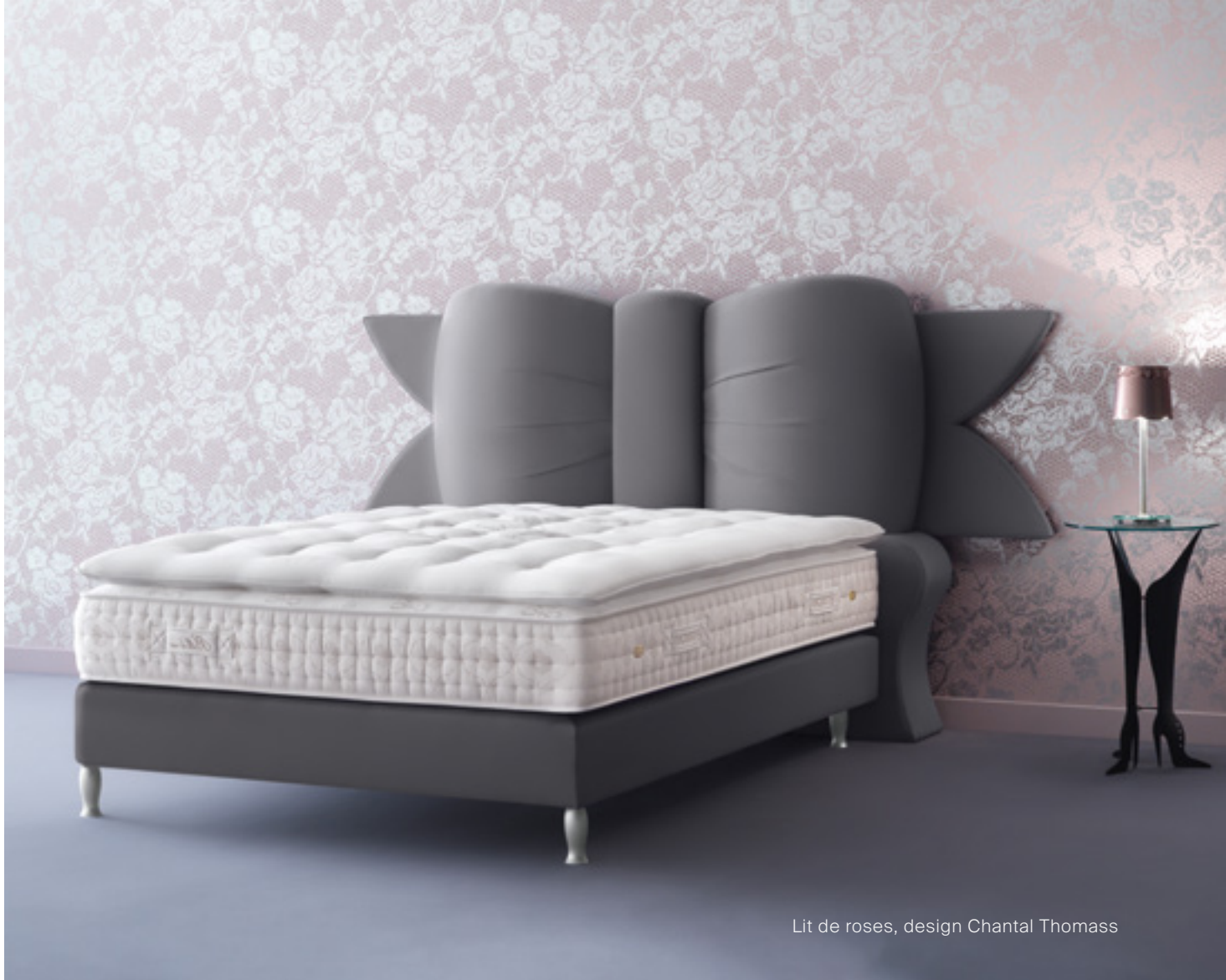
Lit de roses, design Chantal Thomass