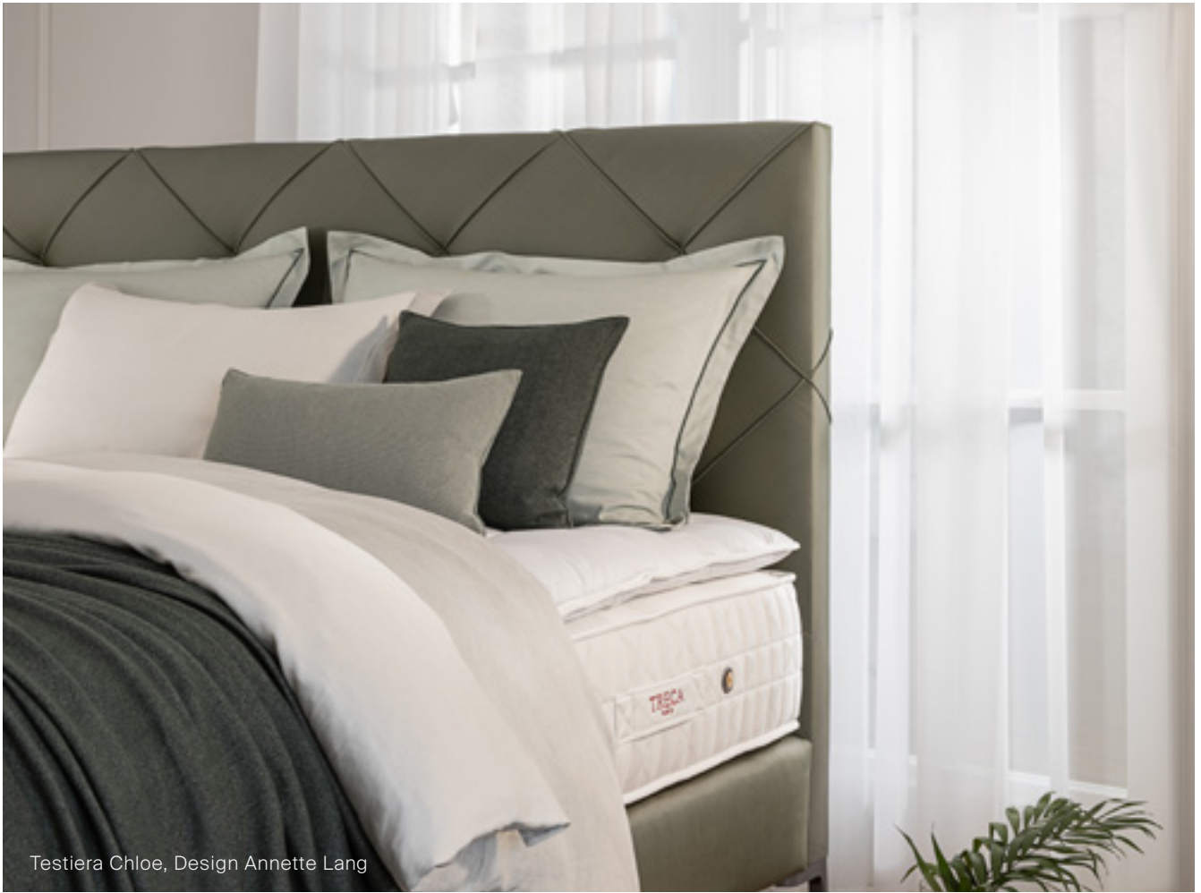
Testiera Chloe, Design Annette Lang