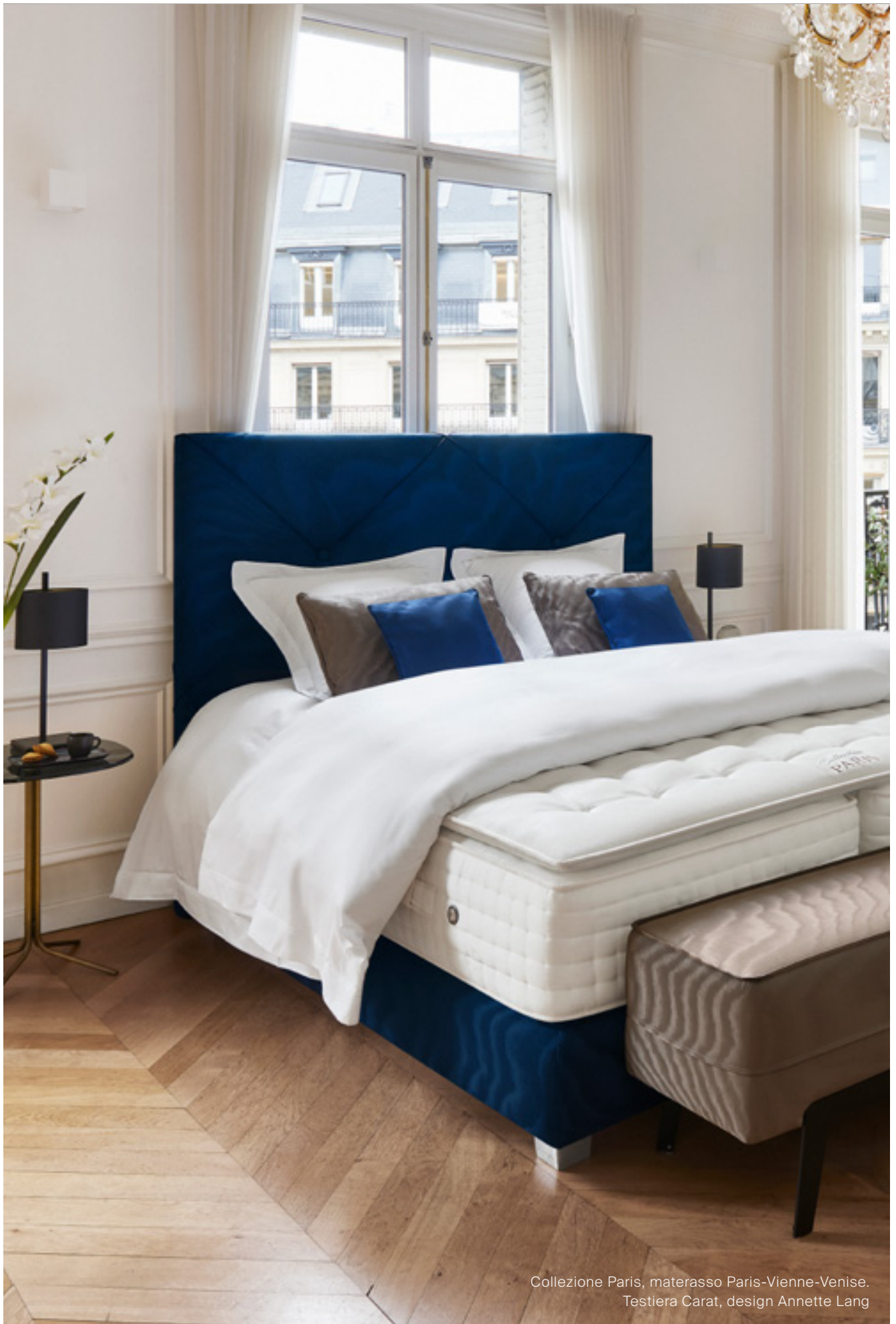
Collezione Paris, materasso Paris-Vienne-Venise. Testiera Carat, design Annette Lang