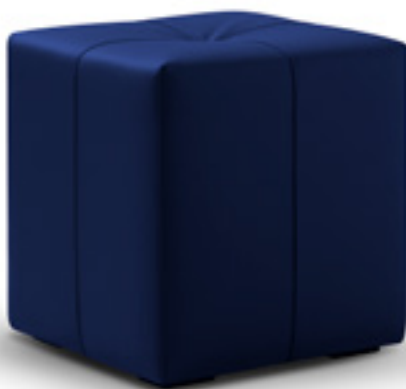
Pouf Coco, design Annette Lang

Per coloro che desiderano aggiungere un tocco personalizzato all'arredamento della propria camera da letto, i nostri cuscini decorativi, disponibili in due finiture (con cordoncino o con volant), e un plaid rappresentano la soluzione ideale. Scegliete tra una varietà di tessuti, tra i nostri campionari di tessuti Tréca, per personalizzare l'insieme della vostra camera da letto in base ai vostri gusti e alle vostre preferenze. Con questi accessori accuratamente selezionati, potrete trasformare la vostra camera da letto in un'oasi di comfort e stile.