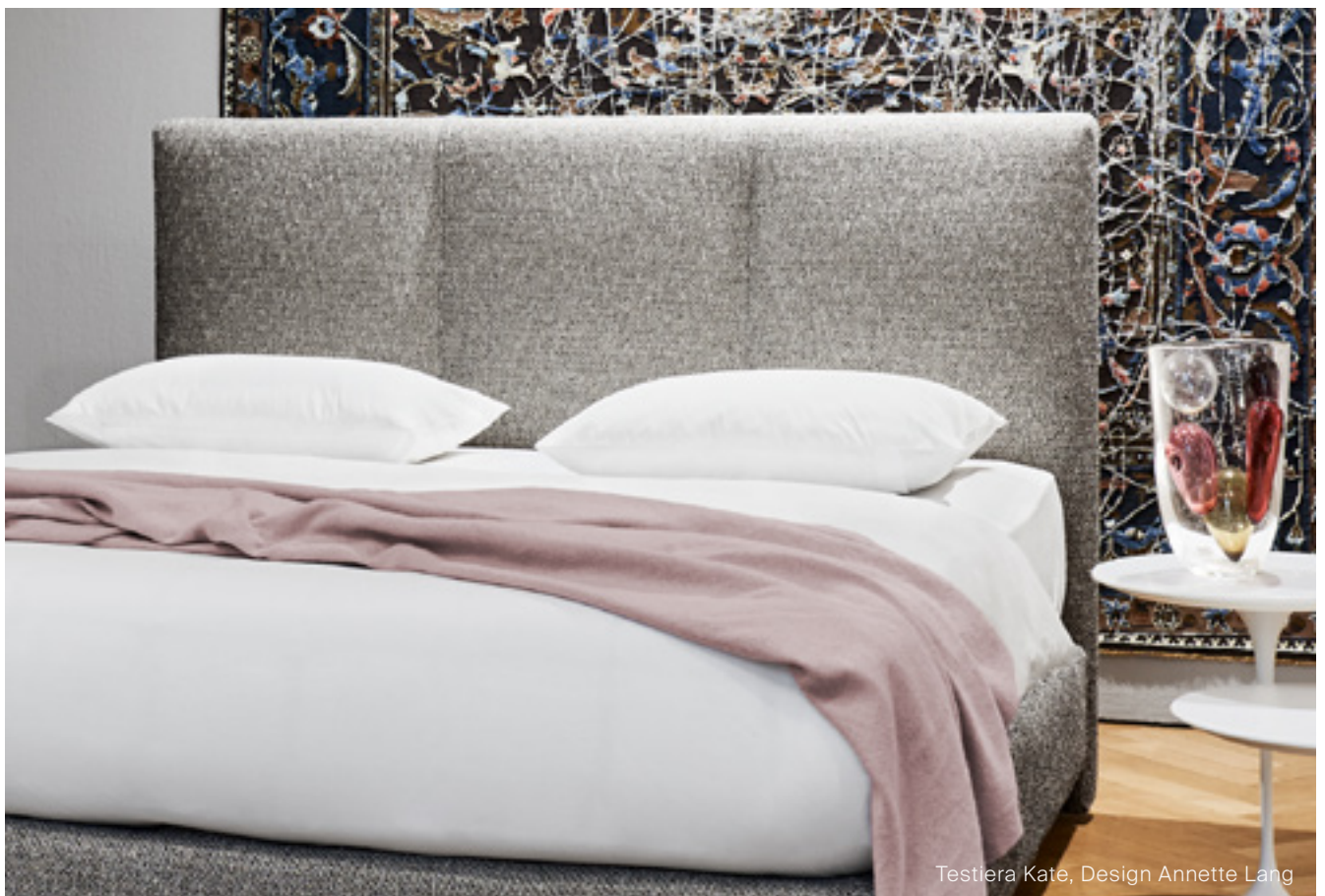
Testiera Kate, Design Annette Lang