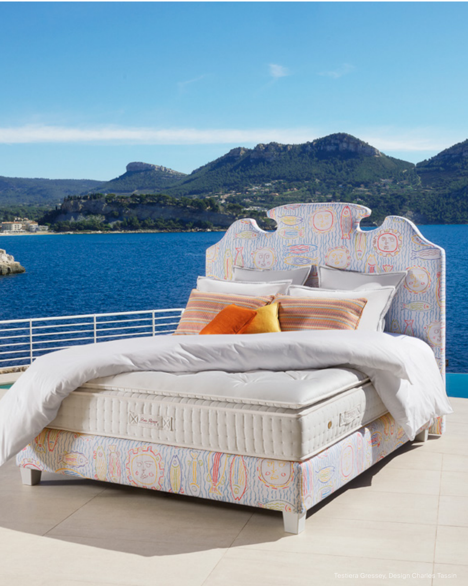
Testiera Gressey, Design Charles Tassin