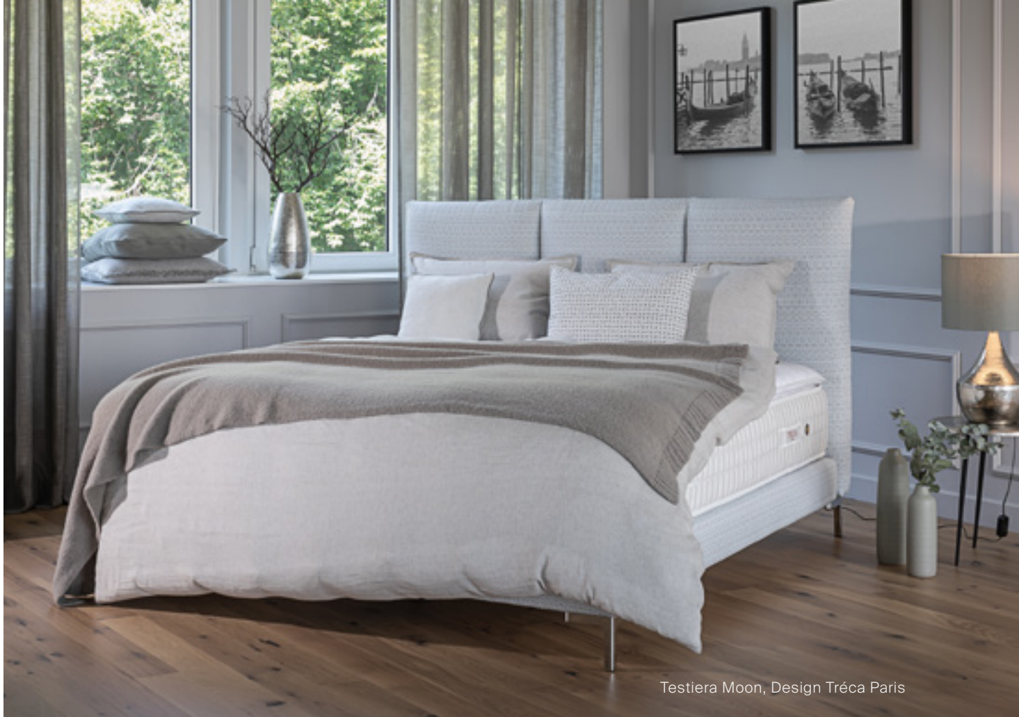
Testiera Moon, Design Tréca Paris