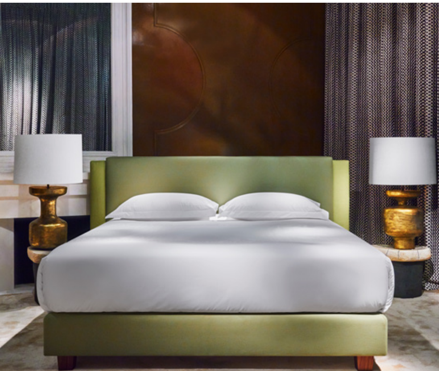
Alezane, design Charles Tassin