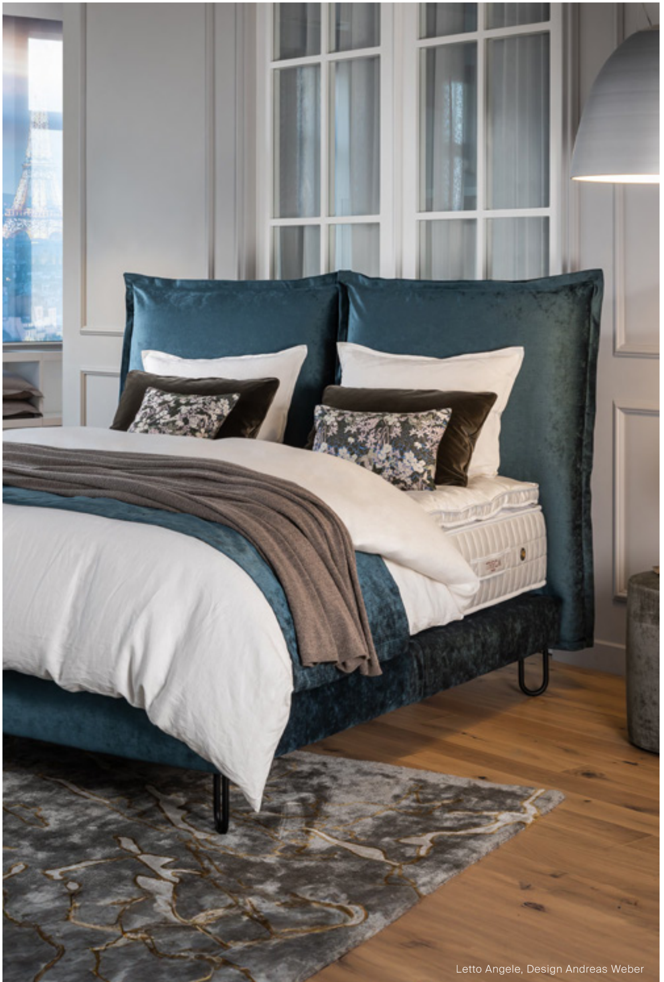
Letto Angele, Design Andreas Weber