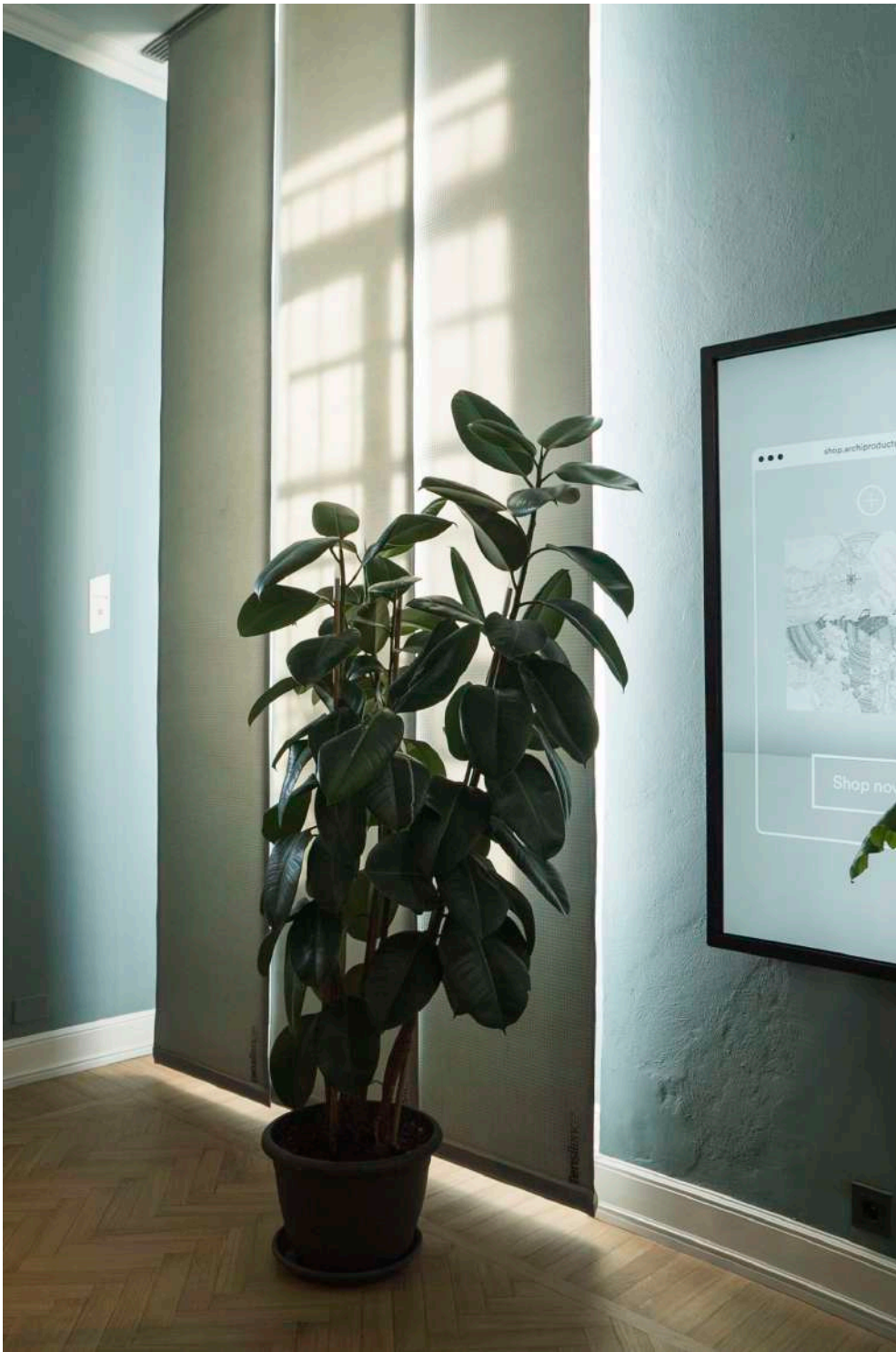
Tenda Combo 3D