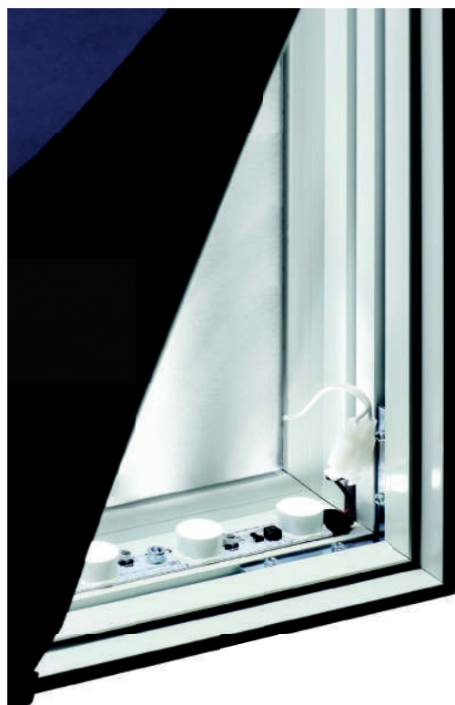
Particolare del profilo con illuminazione

Tutto il materiale è FR. i colori utilizzati sono puramente indicativi e non vincolanti. Colori e accessori possono essere soggetti a modifica.